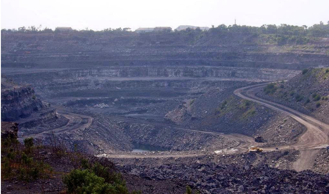
La mina de carbón de Bihar, India.

http://cassandralegacy.blogspot.com.es/2015/05/the-senility-of-elites-coal-mining-must.html